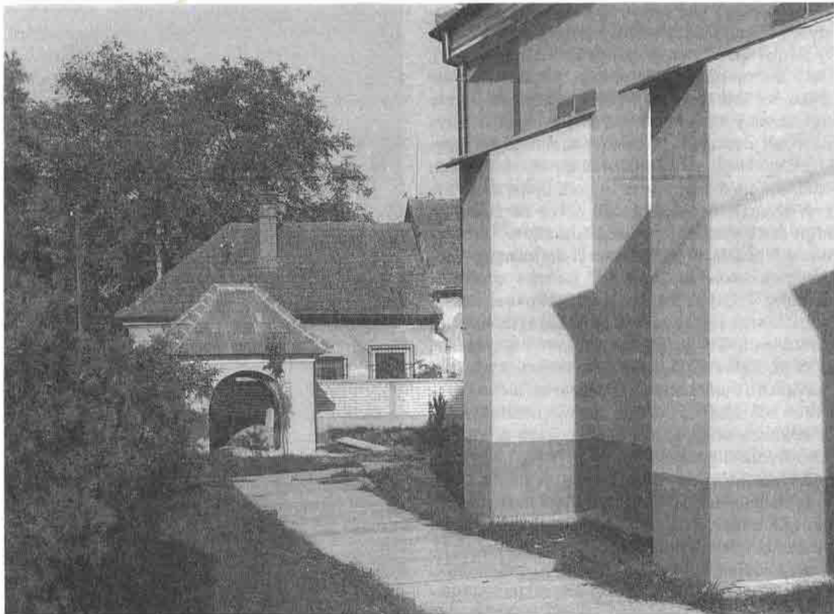
Bývalá žobráčňa pred vstupom do r. k. kostola v Melčiciach, okr. Trenčín. 1989

potravín po krčmách a obchodoch. Obnosené šatstvo predávali starinárom v mestách. V nedeľu a počas sviatkov sedávali žobráci na schodoch kostola a dostávali drobné peniaze. V obciach na Považí pri púťach pútnici robievali zastávky pri sochách svätých na krížnych cestách, na hraničiach chotára. Po skončení modlenia pútnici nahádzali k nohám sochy peniaze, ktoré po odchode sprievodu žobráci vyberali. Po väčších výročných sviatkoch, ako boli Vianoce alebo Veľká noc, tiež po svadbe dostávali žobráci po domoch zvyšky koláčov. Ak ich nazbierali väčšie množstvo, predávali ich ako krmivo pre hydinu.