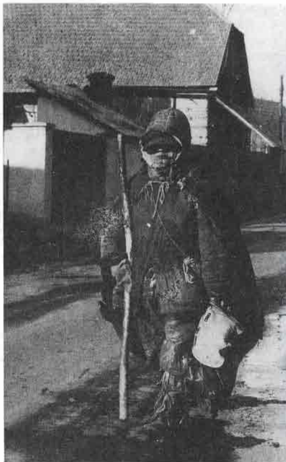
Žobrák z Chocholnej, okr. Trenčín. 40. roky 20. stor.

Cudzí žobráci, ktorí prichádzali do dedín, boli jednotlivci, najčastejšie pár – muž so ženou. Nezistili sme vytváranie väčších zoskupení, v ktorých by bola istá štruktúra, spolupráca, deľba práce atď. Ako určitá spoločenská skupina, charakterizovaná spôsobom obživy, sa vydeľovali najmä z pohľadu členov lokálneho spoločenstva. Nazdávame sa, že najmä toto vydeľovanie zo spoločenstva nútilo potulných žobrákov k vzájomnej pomoci, a tým i k istej spolupatričnosti.