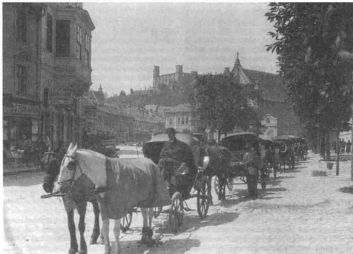
Stanovisko drožkárov v starej Bratislave. 20. roky.

a complement to the Slovak cultural history, but due to human and ethical ideas of the people being in the background of the studied phenomena, they represent an important component of historical experience of the people in the sphere of his social links and social communication.